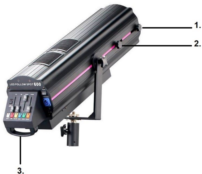
Рис.1. Вид сзади, справа.