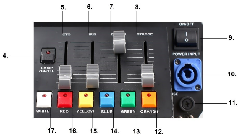
Рис.2. Задняя часть панели